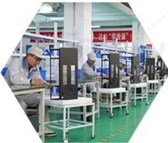
Product assembly process