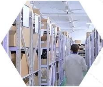
Warehouse spare parts