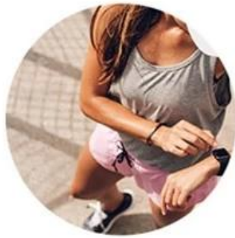
SPEED 810nm For yellow neutral skin (brown hair removal)