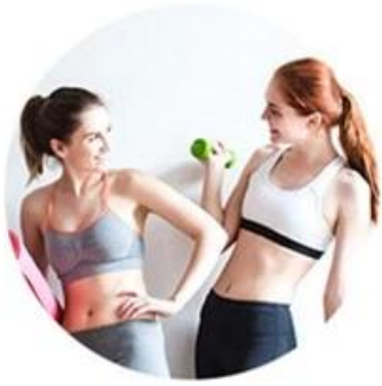
ALEX 755nm For white skin (fine, golden hair removal )