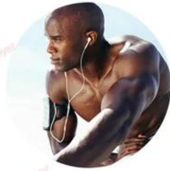
YAG 1064nm For black skin (black hair removal)