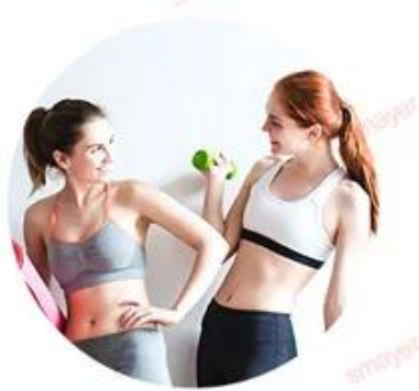
ALEX 755nm For white skin (fine, golden hair removal )