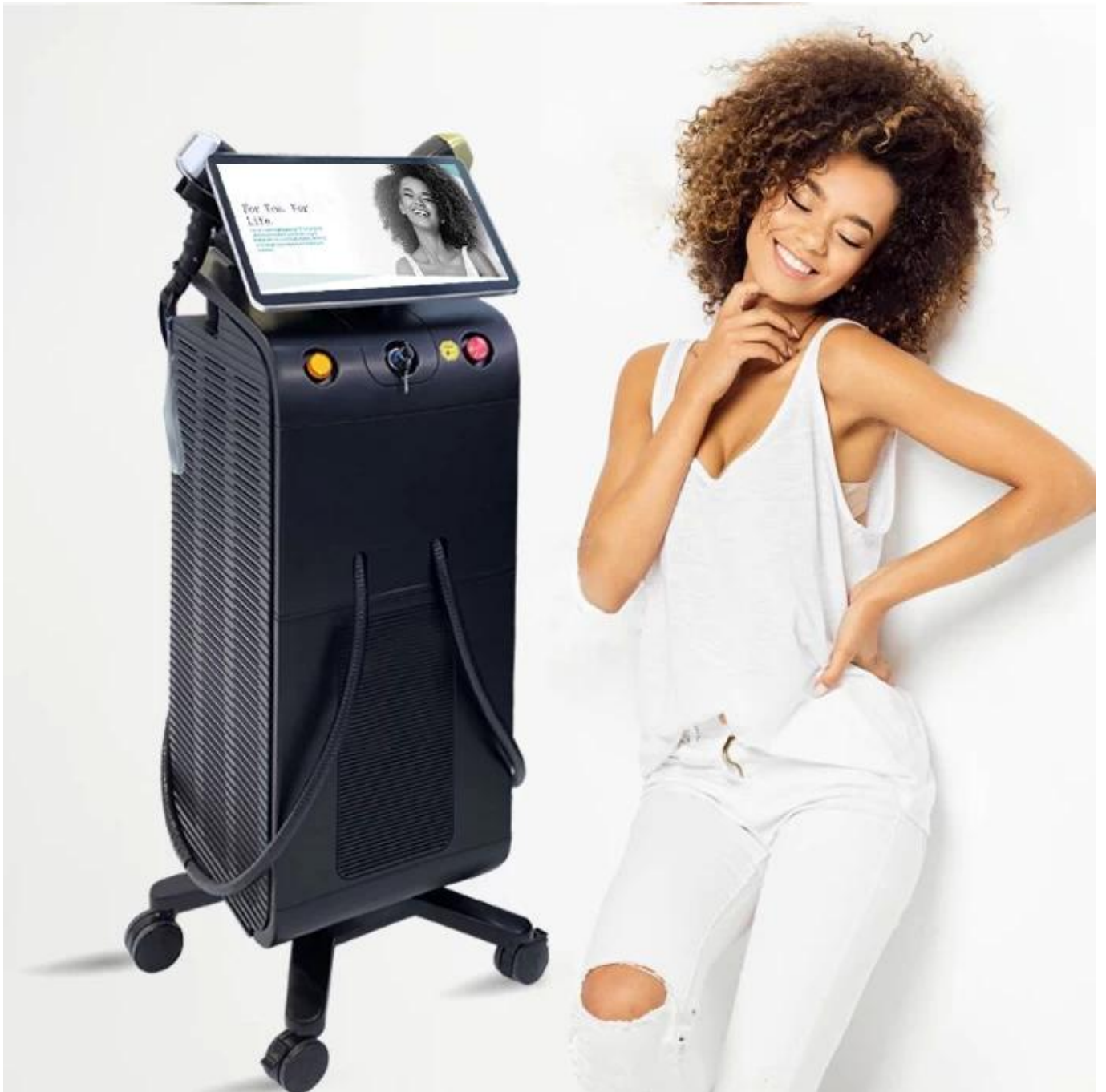
Luft Wasser Kompressorkühlung Eisgefühl-Behandlung, bequem und schmerzlos