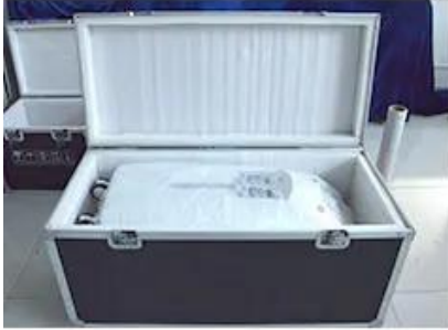
Built-in prevention Collision bubble