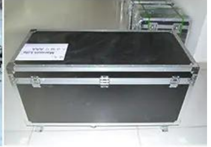
3-5 business days delivery