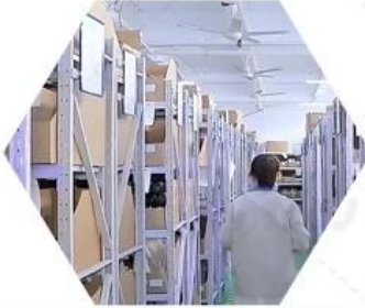
Warehouse spare parts