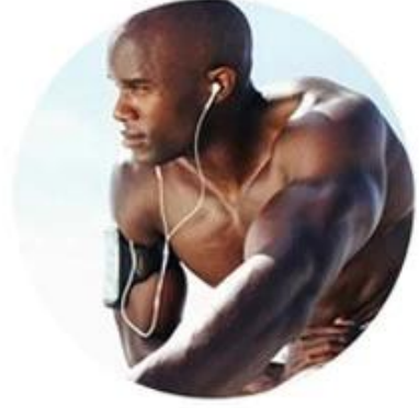
YAG 1064nm For black skin (black hair removal)