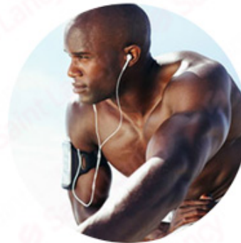
YAG 1064nm For black skin (black hair removal)