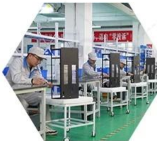
Product assembly process