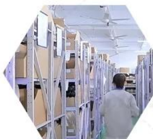
Warehouse spare parts