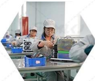
Quality inspection of finished products