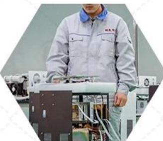
Quality inspection of finished products