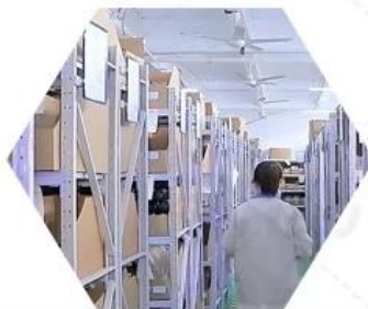
Warehouse spare parts