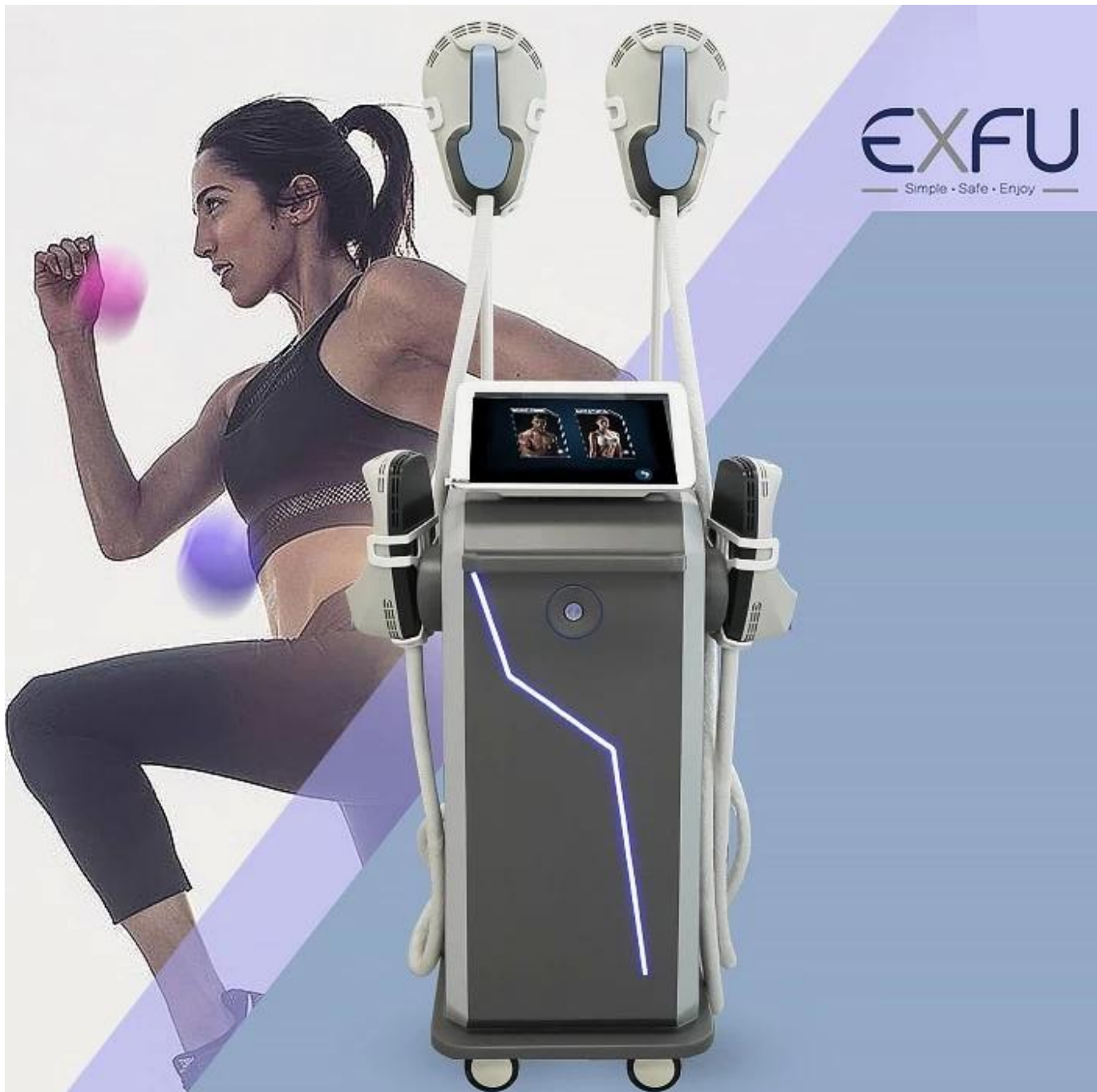
EMF 2020 2020 Ems hiemt pro machine EMF 2020 2020 2020 2020 2020 2020 2020 EMS 2020