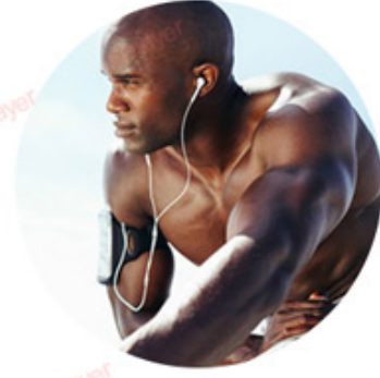
YAG 1064nm For black skin (black hair removal)