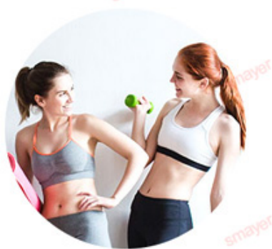
ALEX 755nm For white skin (fine, golden hair removal )