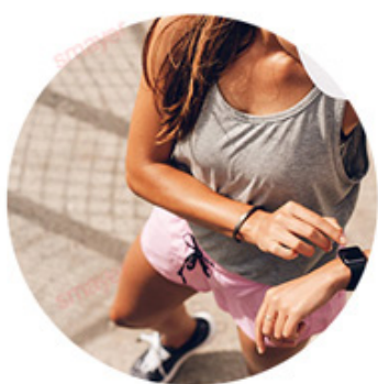
SPEED 810nm For yellow neutral skin (brown hair removal)