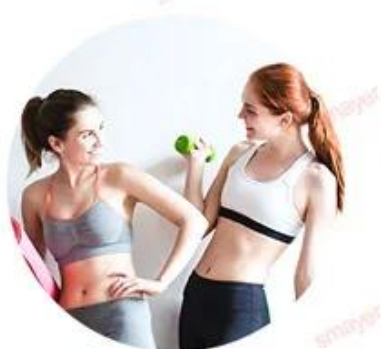
ALEX 755nm For white skin (fine, golden hair removal )