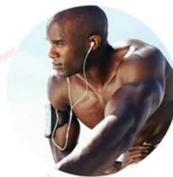
YAG 1064nm For black skin (black hair removal)