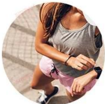
SPEED 810nm For yellow neutral skin (brown hair removal)