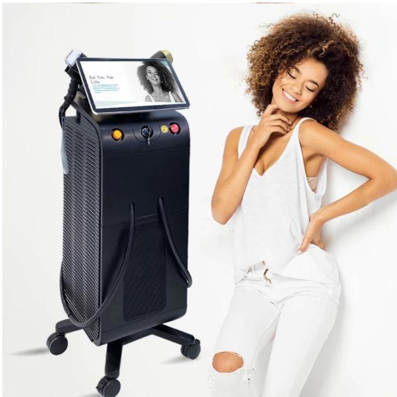
Chłodzenie powietrze woda kompresor Zabieg Ice Sensation, komfortowy i bezbolesny