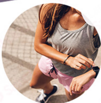
SPEED 810nm For yellow neutral skin (brown hair removal)