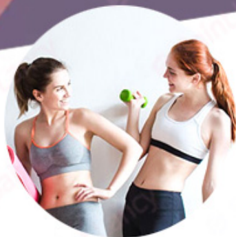
ALEX 755nm For white skin (fine, golden hair removal )