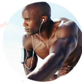
YAG 1064nm For black skin (black hair removal)