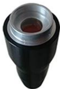
Black doll 1320nm