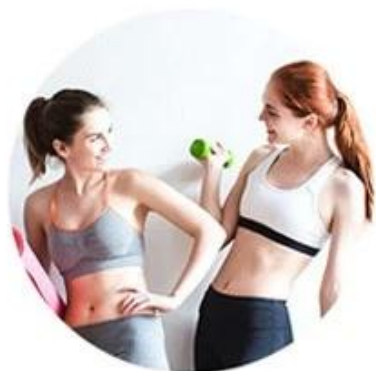
ALEX 755nm For white skin (fine, golden hair removal )