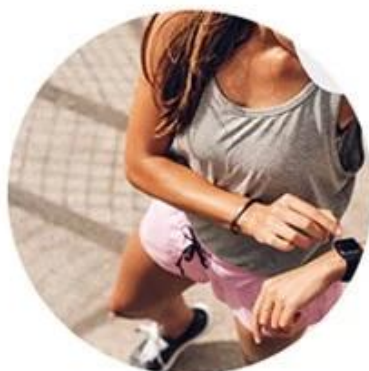
SPEED 810nm For yellow neutral skin (brown hair removal)