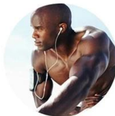
YAG 1064nm For black skin (black hair removal)