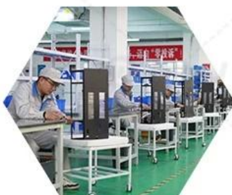
Product assembly process