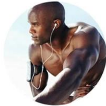
YAG 1064nm For black skin (black hair removal)