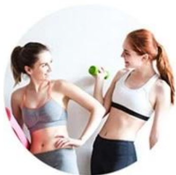
ALEX 755nm For white skin (fine, golden hair removal )

7558081064 нм, подходит для перманентного удаления волос всех типов кожи