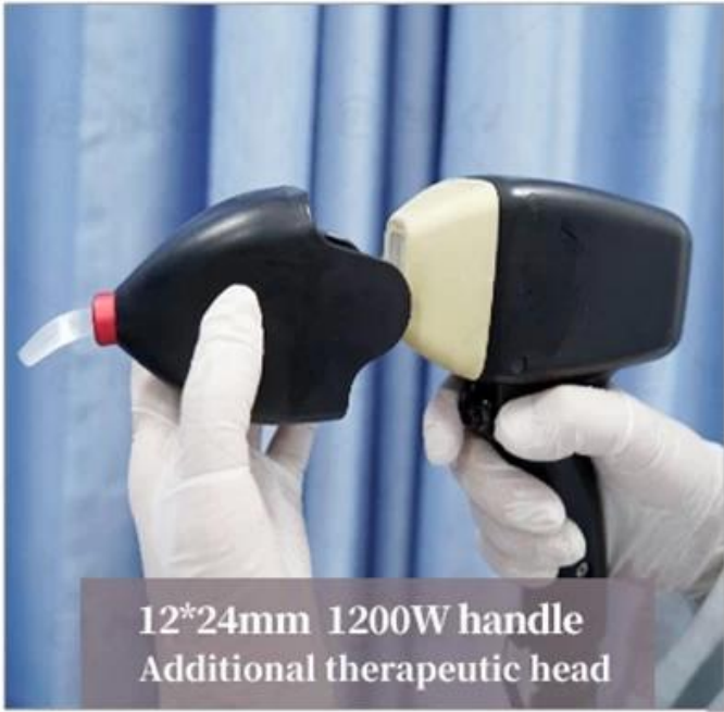
12*24mm 1200W handle Additional therapeutic head