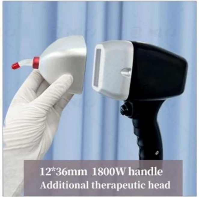
12*36mm 1800W handle Additional therapeutic head