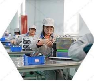
Quality inspection of finished products