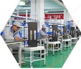
Product assembly process