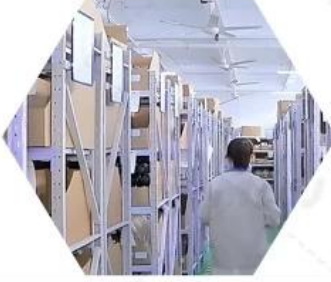
Warehouse spare parts