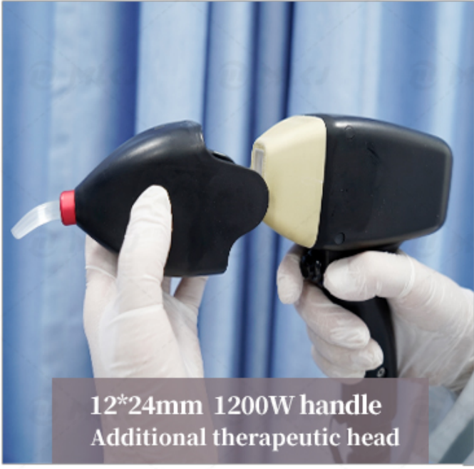
12*24mm 1200W handle Additional therapeutic head