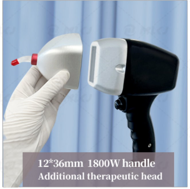
12*36mm 1800W handle Additional therapeutic head